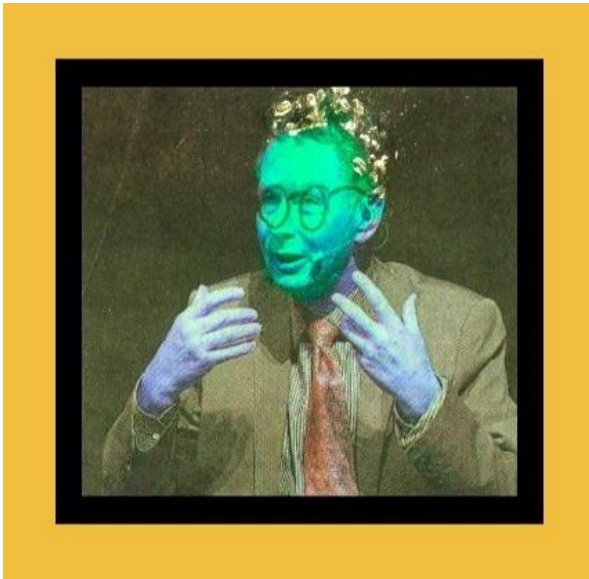
Venusine, I. ODJ Re.

13'610, trat Marsiano sein Mandat im Osten an.