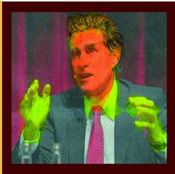
Marsiano, I. ODJ. Ost

Restamora steht ein für freien Kommerz, dem Ostamora, die idealistische ‚Neue alternative Republik‘ einst öffentlich abschwörte! Marsiano der reiche und mächtige Bankier der aber auch ein gosses Idealist war, gab einst die Führung seines Bankinstitutes auf, um sich einer neuen Führungsaufgabe zuzuwenden, die der neuen Ostrepublik, die da soeben erschaffen worden war.