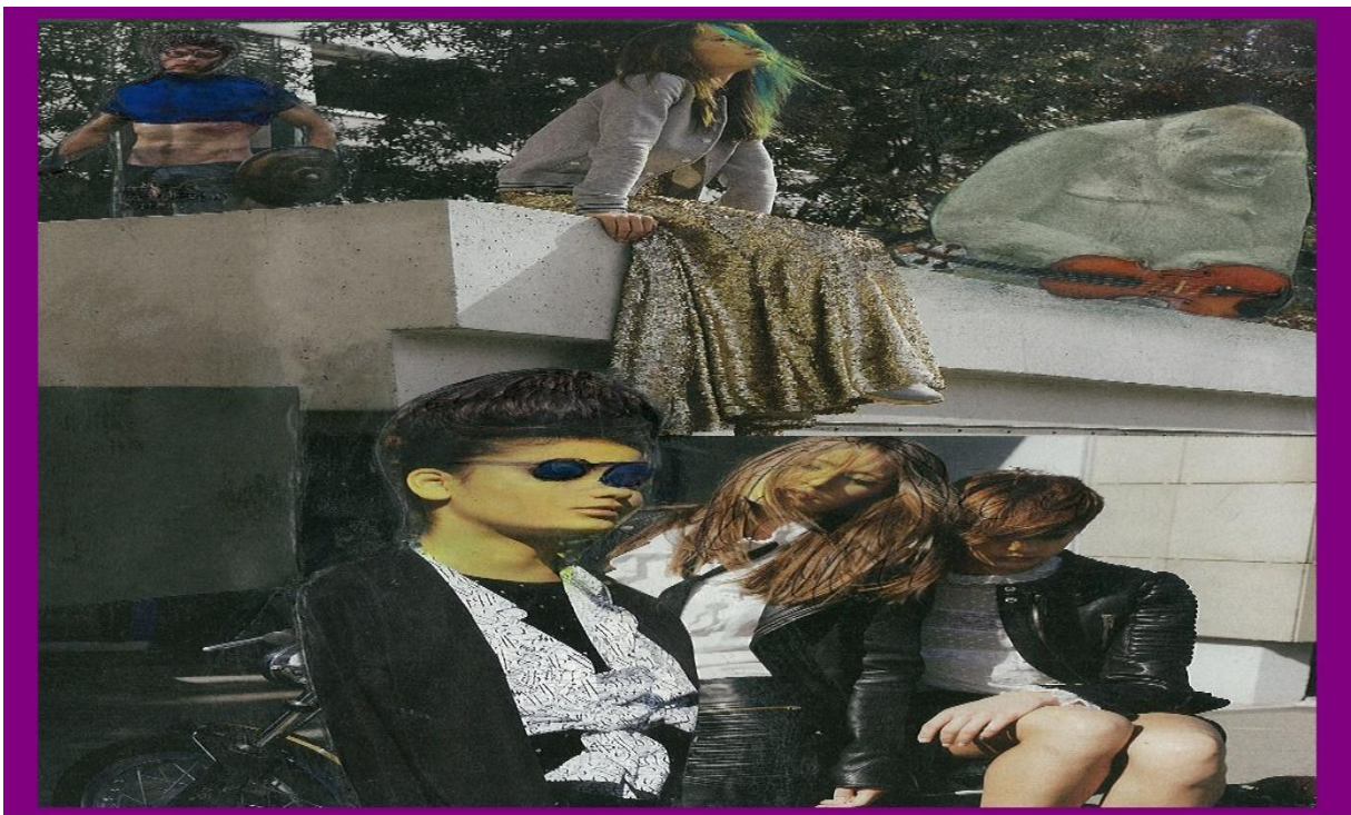
Entspannung ist angesagt, vor und auf der Mauer!